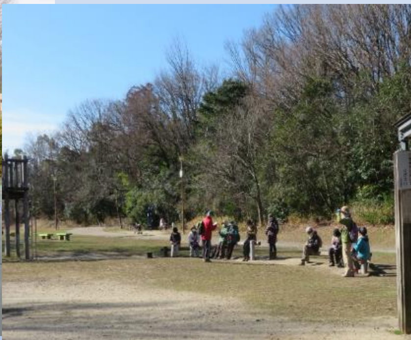
バードウォッチング