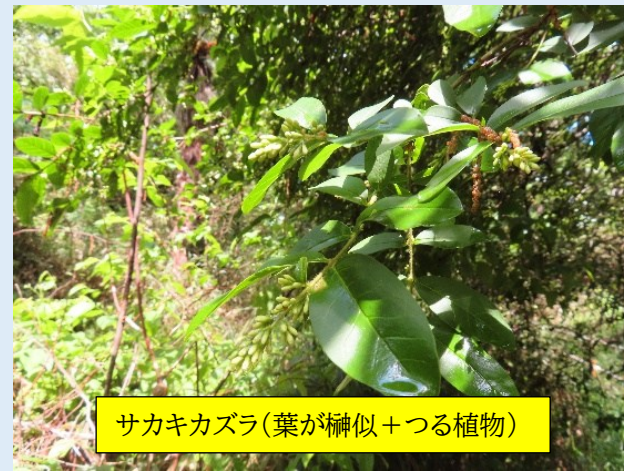
サカキカズラ(葉が神似+つる植物)