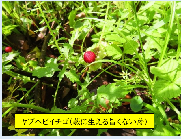
ヤブヘビイチゴ(藪に生える旨くない苺)