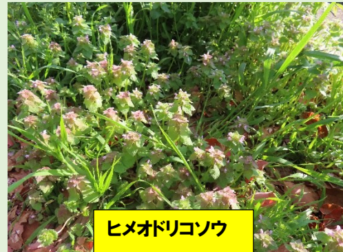
ヒメオドリコソウ