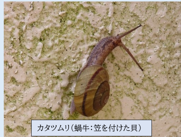
カタツムリ(蝸牛:笠を付けた貝)