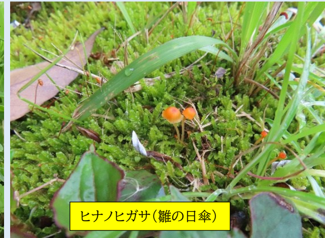
ヒナノヒガサ(雛の日傘)