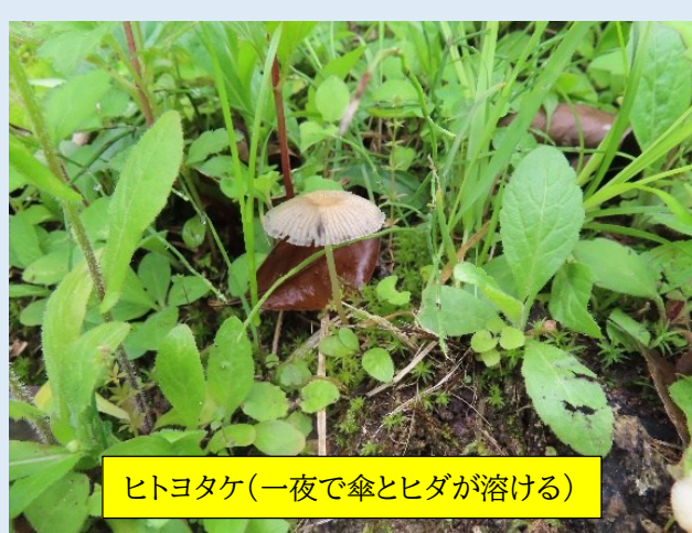
ヒトヨタケ(一夜で傘とヒダが溶ける)