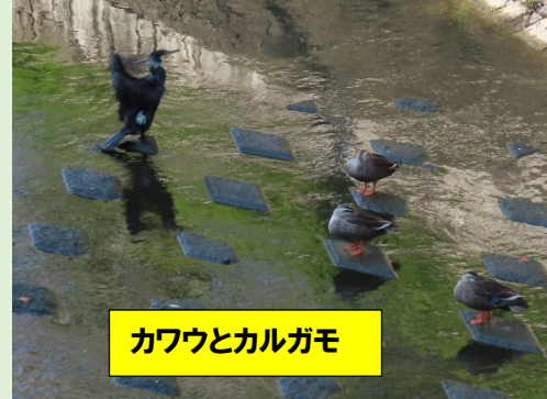
カワウとカルガモ