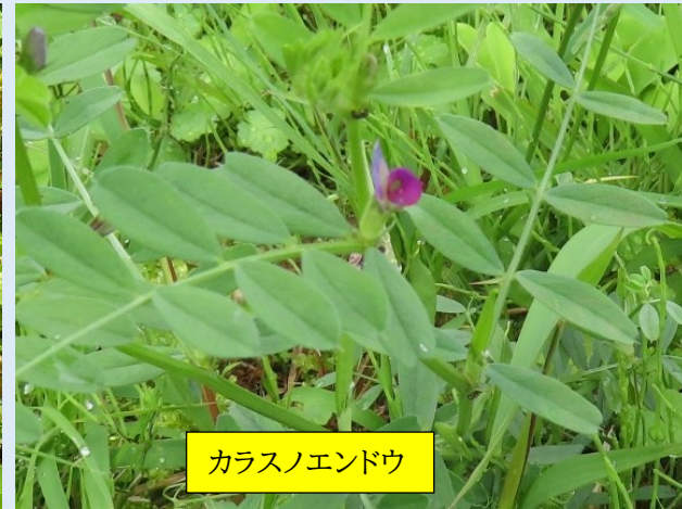
カラスノエンドウ