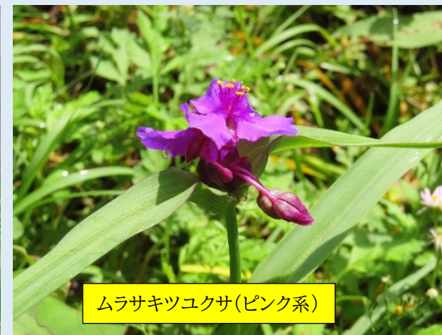
ムラサキツユクサ(ピンク系)