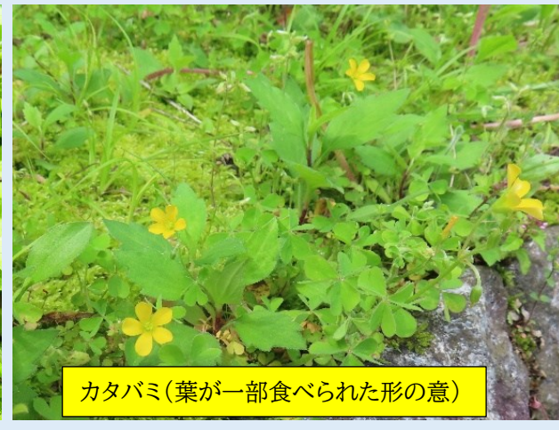
カタバミ(葉が一部食べられた形の意)