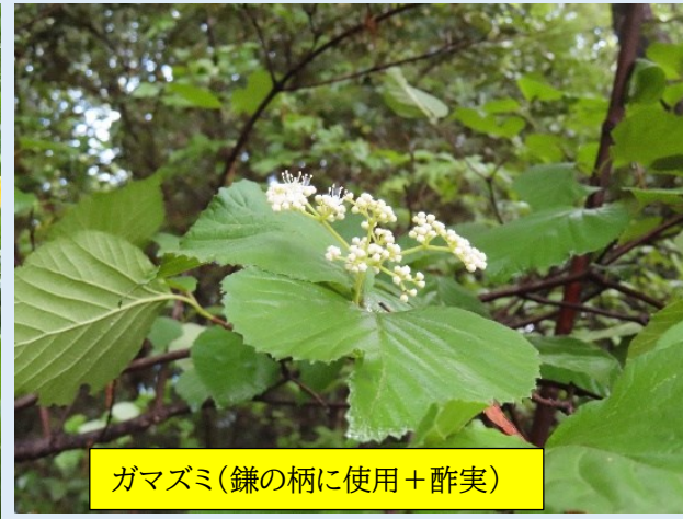
ガマズミ(鎌の柄に使用+酢実)