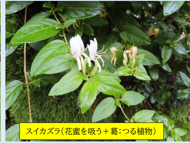
スイカズラ(花蜜を吸う+葛:つる植物)