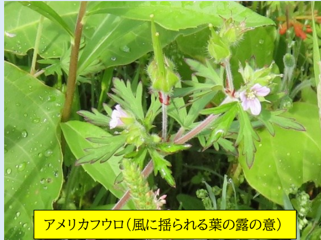
アメリカフウロ(風に揺られる葉の露の意)