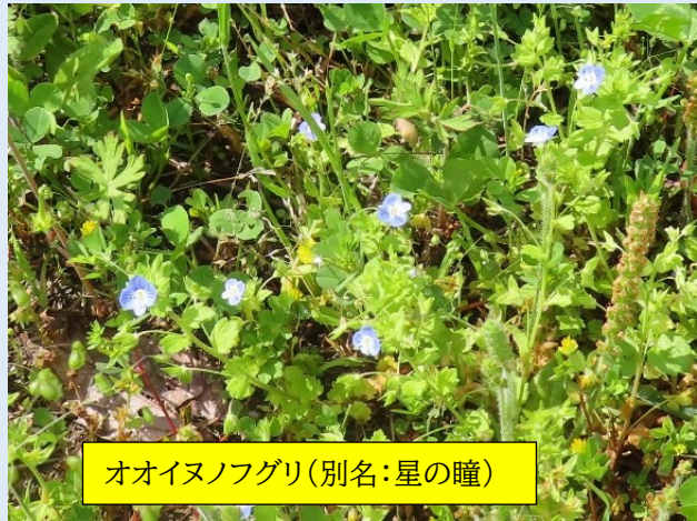
オオイヌノフグリ(別名:星の瞳)