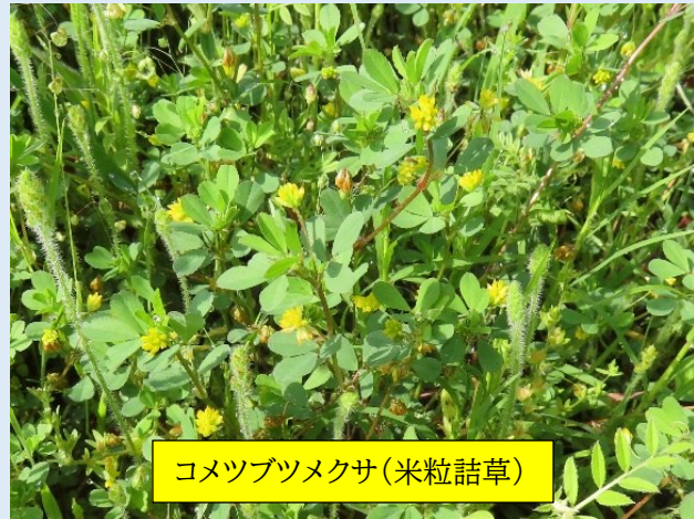
コメツブツメクサ(米粒詰草)