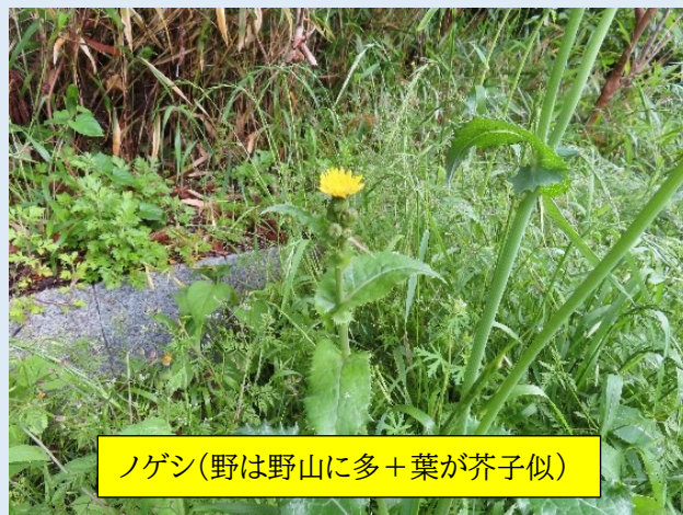
ノゲン(野は野山に多+葉が芥子似)