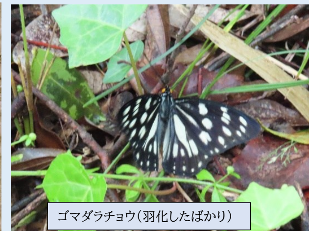
ゴマダラチョウ(羽化したばかり)