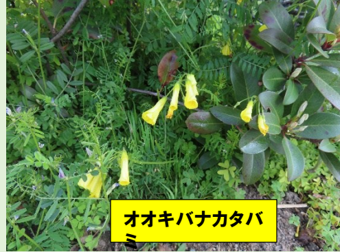
オオキバナカタバミ