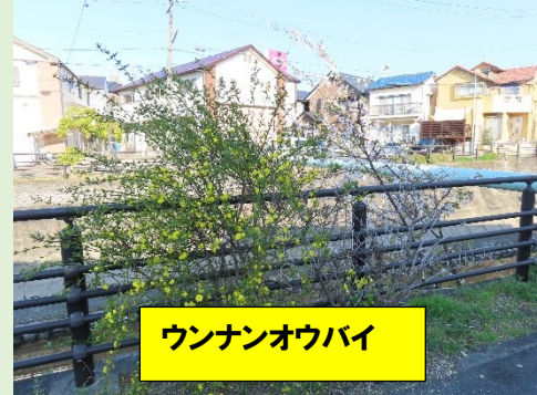
ウツノミヤオウバイ