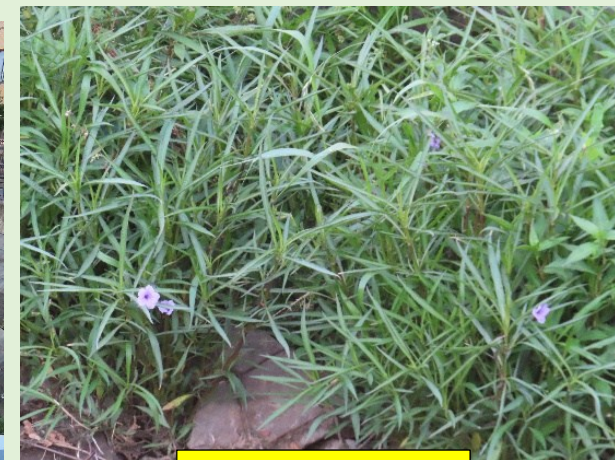
ヤナギバルイランソウ