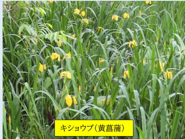
キシヨウブ(黄菖蒲)