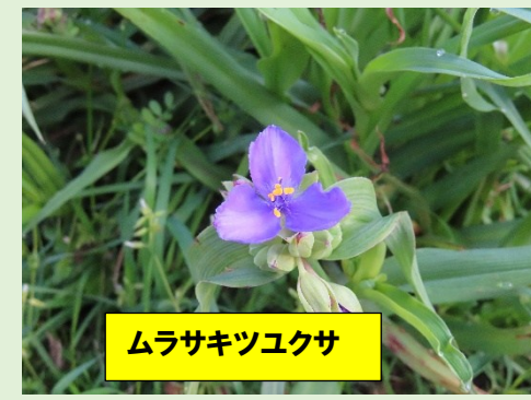
ムラサキツユクサ