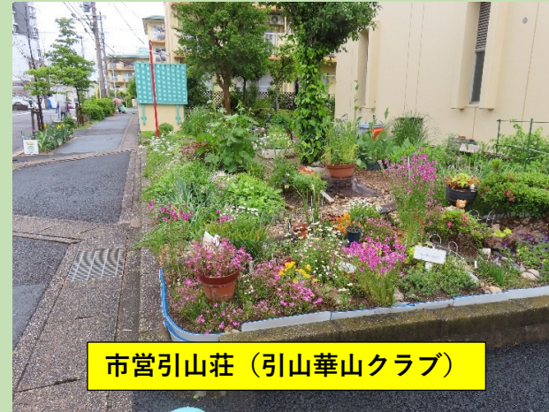
市営引山荘（引山華山クラブ）