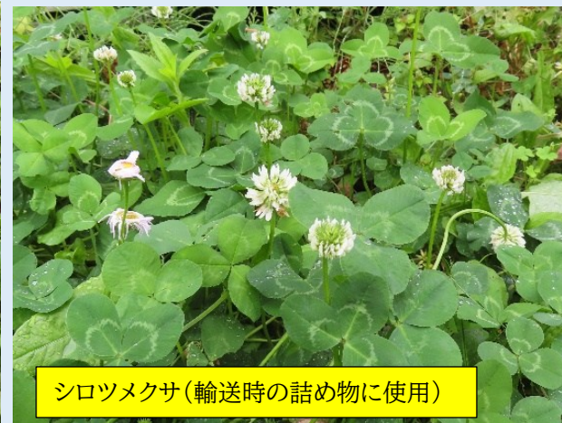
シロツメクサ(輸送時の詰め物に使用)