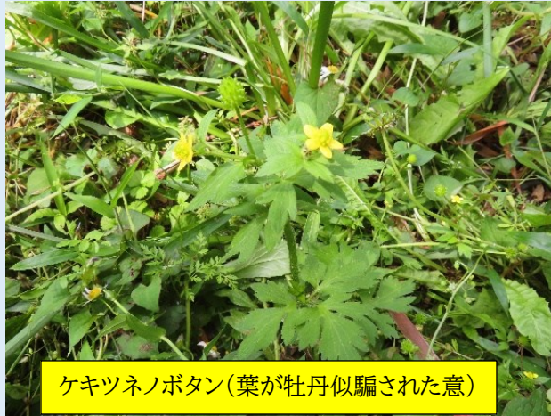
ケキツネノボタン(葉が牡丹似騙された意)