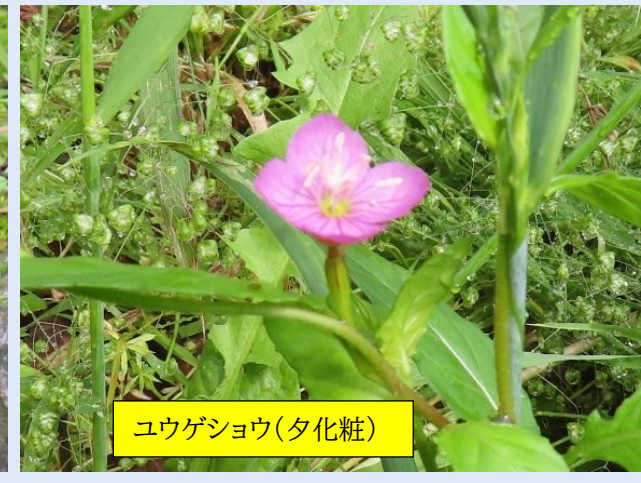
ユウゲショウ(夕化粧)