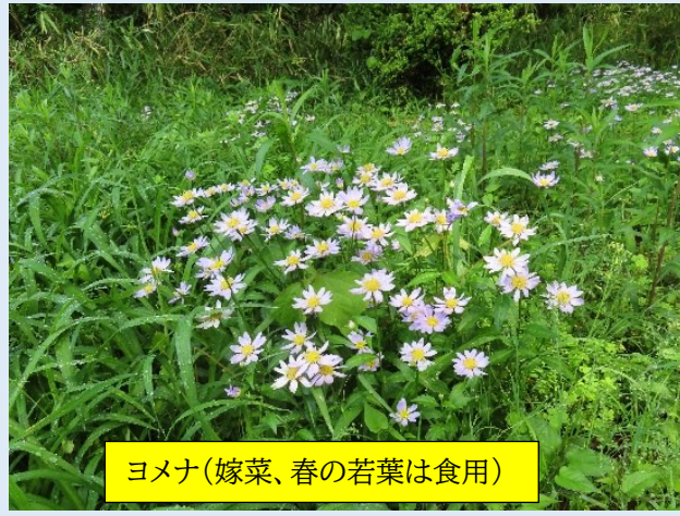
ヨメナ(嫁菜、春の若葉は食用)