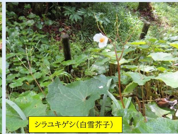
シラユキゲシ(白雪芥子)