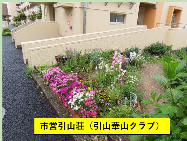
市営引山荘（引山華山クラブ）