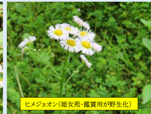
ヒメジョオン(姫女苑・鑑賞用が野生化)