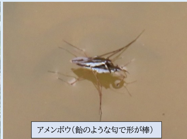
アメンボウ(飴のような匂で形が棒)