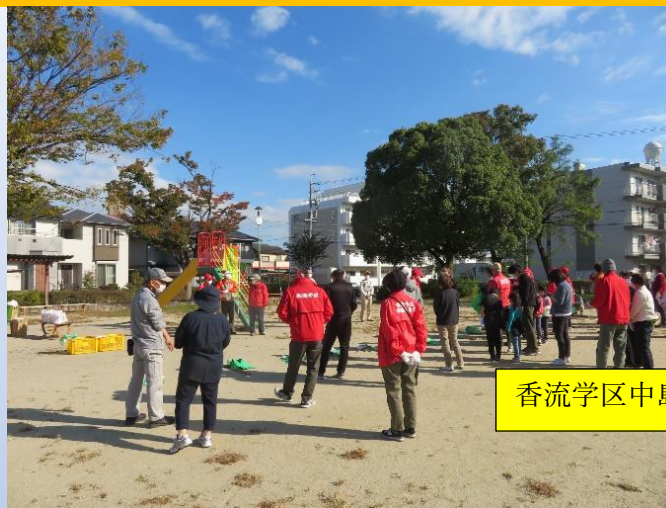
香流学区中島公園集合