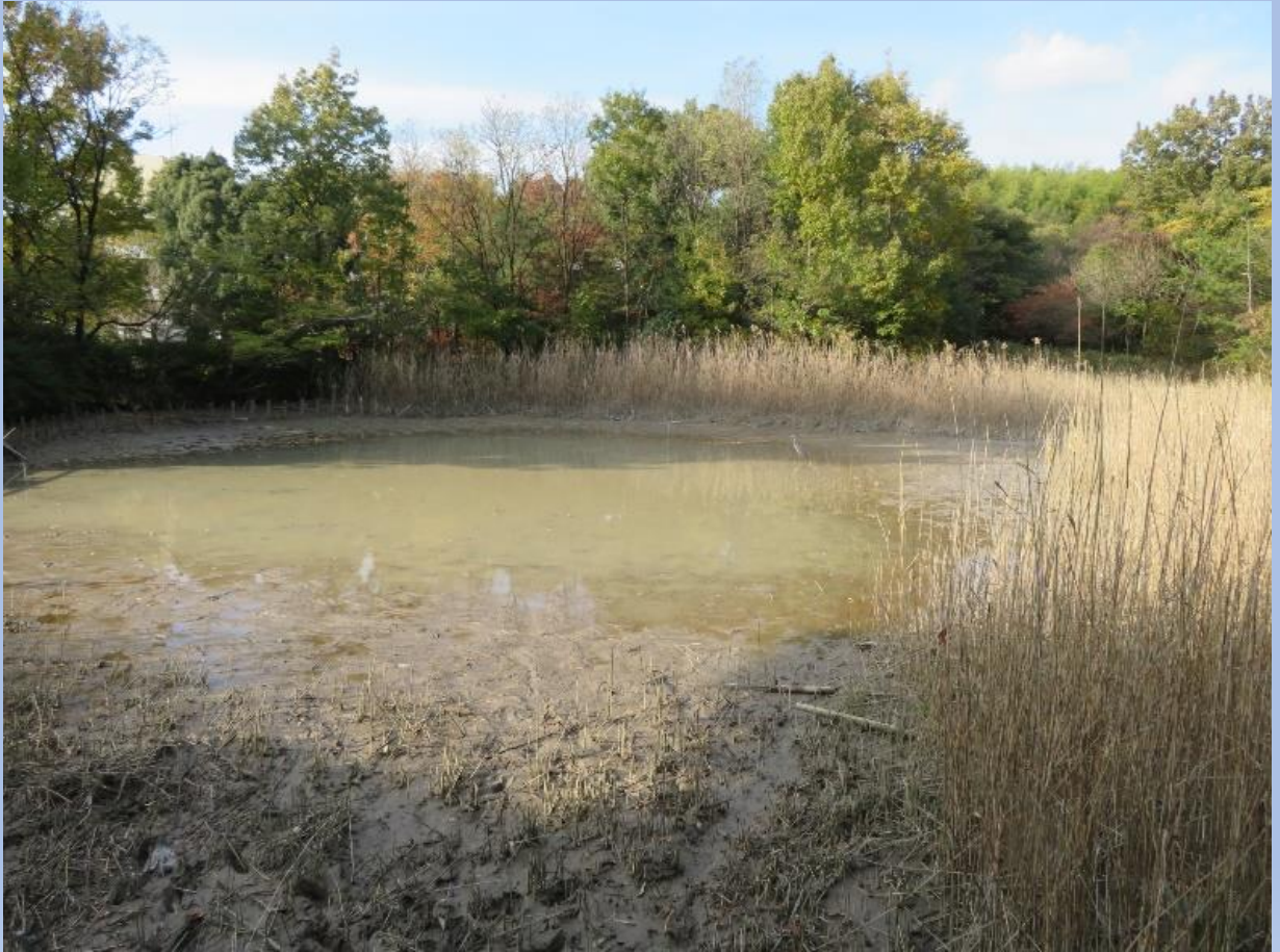
池干しの様子 (11/16中日新聞掲載) 外来種多数生息していた。