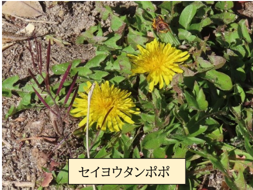
セイヨウタンポポ