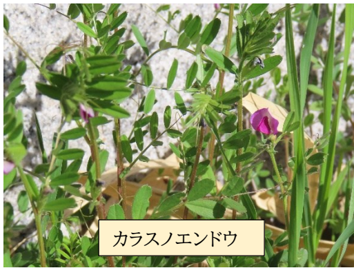
カラスノエンドウ