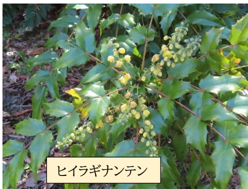
ヒイラギナンテン