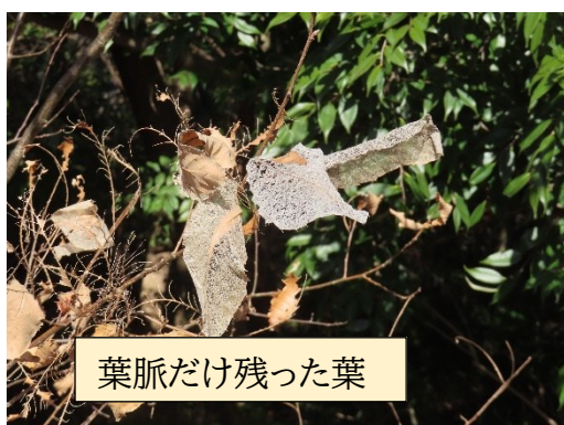
葉脈だけ残った葉