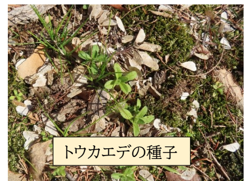
トウカエデの種子