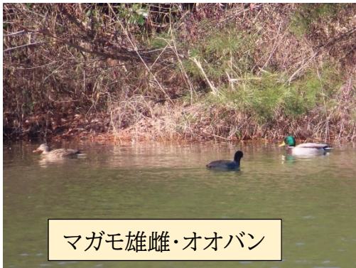
マガモ雄雌・オオバン