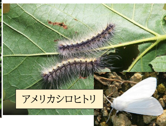
アメリカシロヒトリ