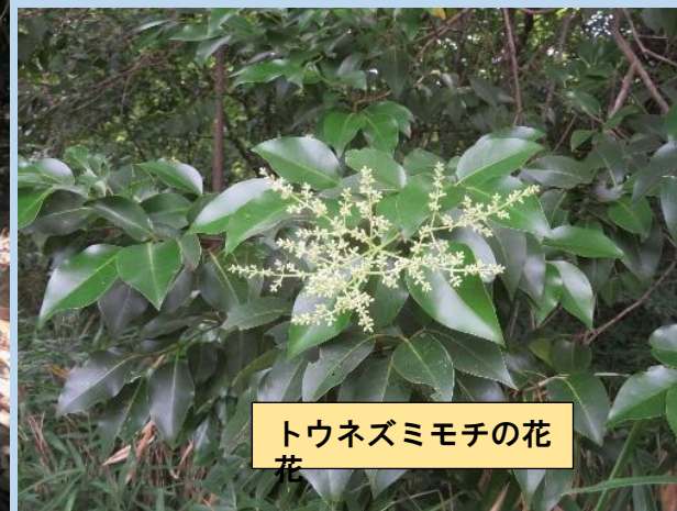
トウネズミモチの花 花