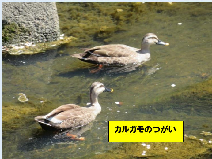
カルガモのつがい