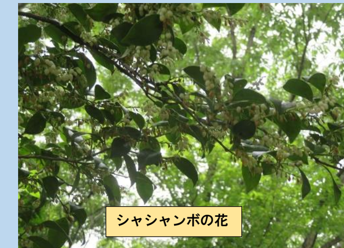
シャシャンボの花