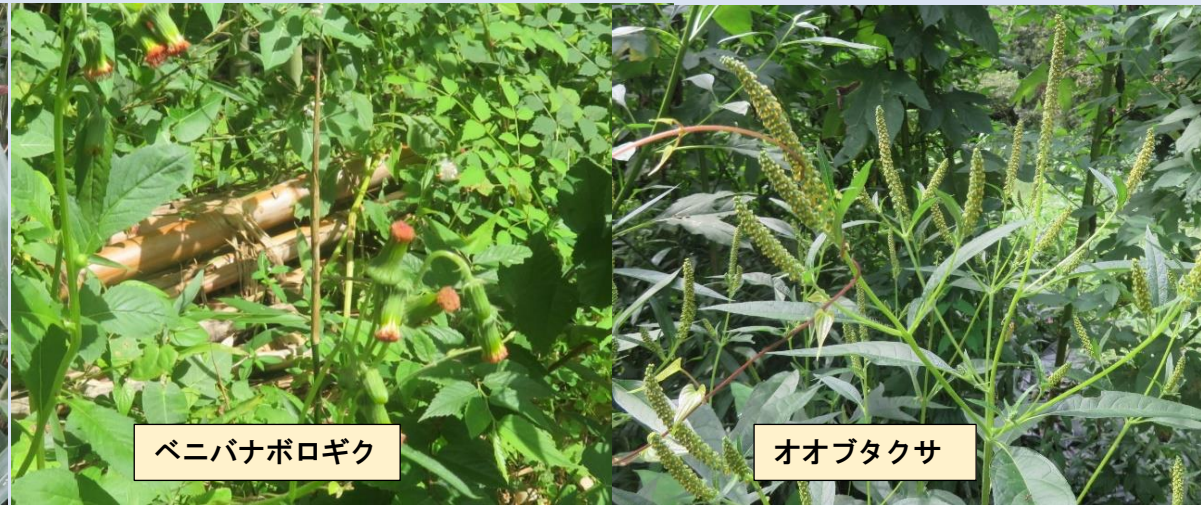
ベニバナボロギク