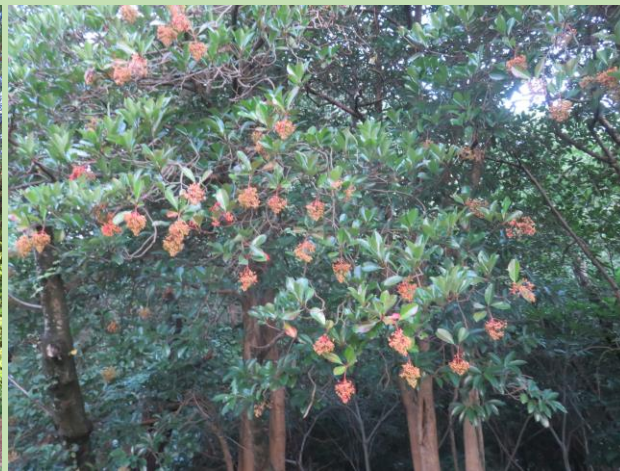
サンゴジュ (珊瑚樹)