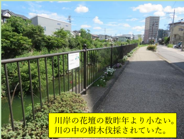
川岸の花壇の数昨年より小さい。 川の中の樹木伐採されていた。