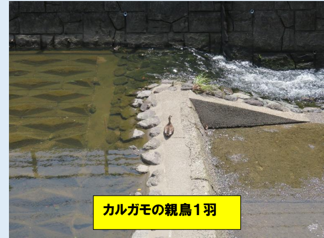
カルガモの親鳥1羽