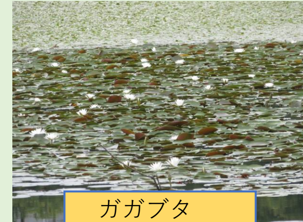
ガガブタ (絶滅危惧種)