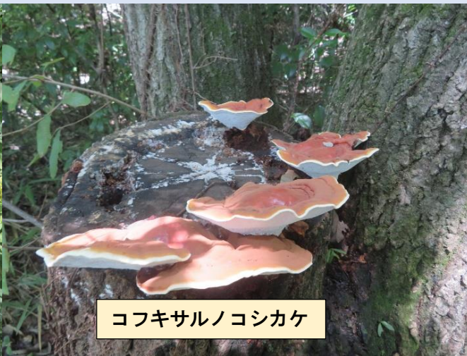
コフキサルノコシカケ