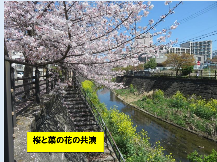
桜と菜の花の共演