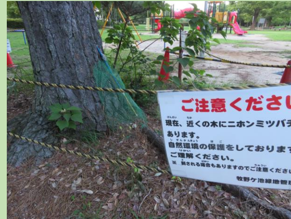
日本ミツバチの巣