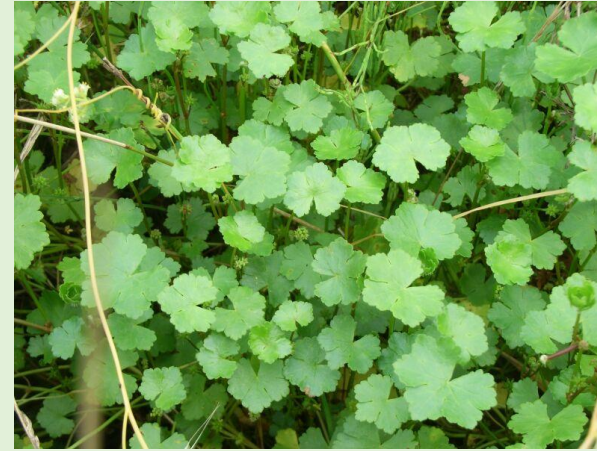
チドメグサ (血止草)