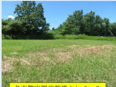
名東警察署前整備されている