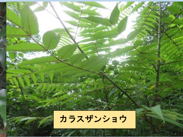
カラスザンショウ