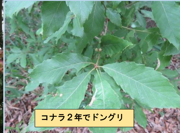
コナラ2年でドングリ