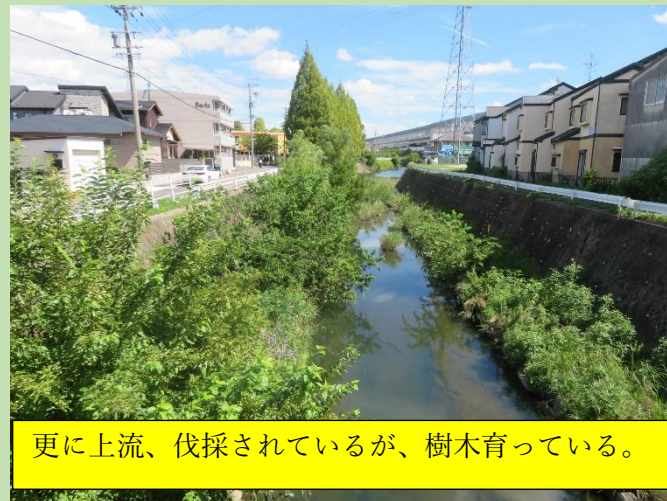
更に上流、伐採されているが、樹木育っている。