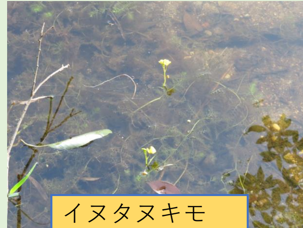
イヌタヌキモ (絶滅危惧種)