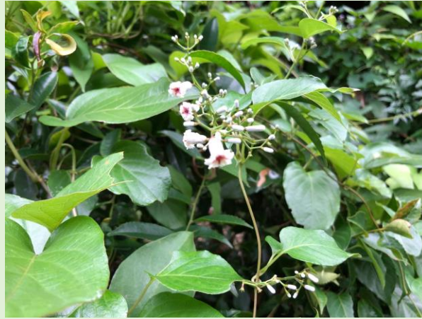
ヘクソカズラ (屁糞)