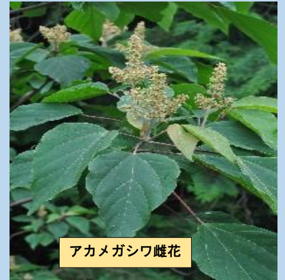
アカメガシワ雌花