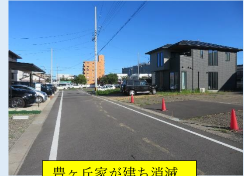
豊ヶ丘家が建ち消滅