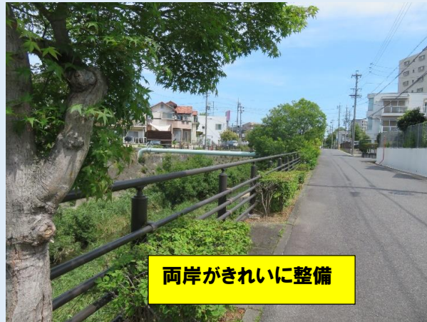
両岸がきれいに整備