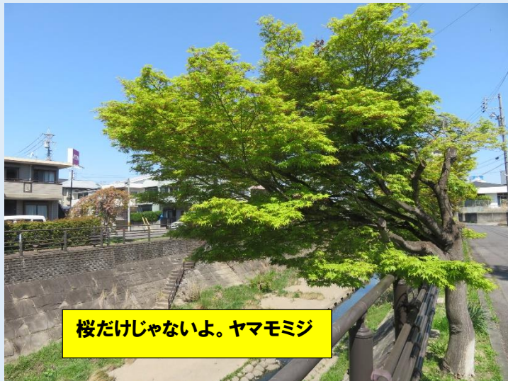
桜だけじゃないよ。ヤマモミジ