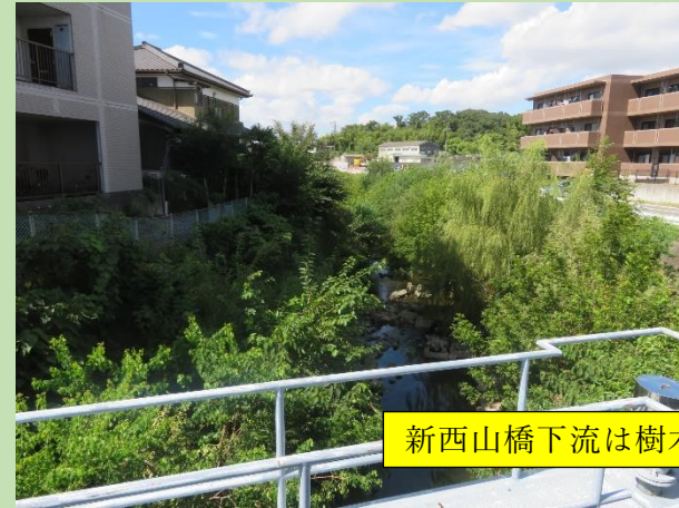
新西山橋下流は樹木が生い茂っている。