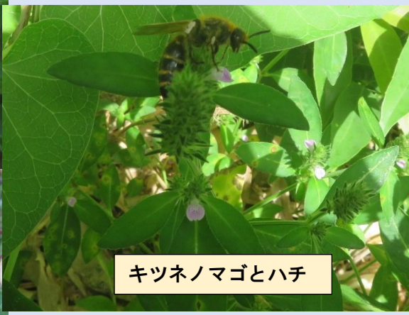
キツネノマゴとハチ