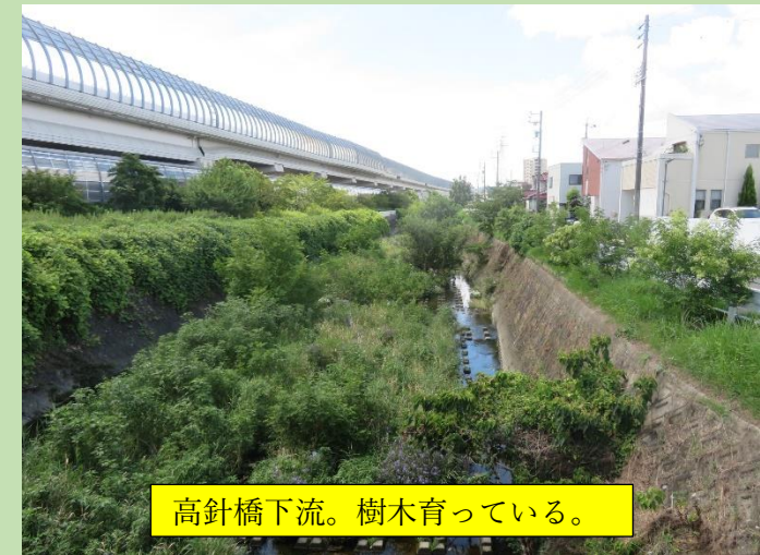
高針橋下流。樹木育っている。