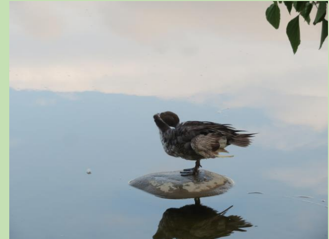
傷ついたオナガガモ