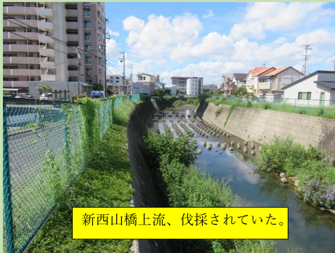
新西山橋上流、伐採されていた。