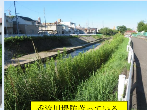
香流川堤防茂っている